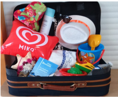
Valise dont il fallait déterminer le poids

Parallèlement, la direction de l'établissement et le maire de la ville ont profité de cet instant pour remercier chaleureusement les membres du club Inner Wheel, qui comme les années précédentes, ont fait un don à l'hôpital de Crépy-en-Valois pour améliorer le bien-être des patients et des résidents. Le don s'élevait à près de 1000€, récoltés lors de divers événements organisés tout au long de l'année. Cette somme a permis d'acquérir des matelas à mémoire de forme et des coussins médicaux.