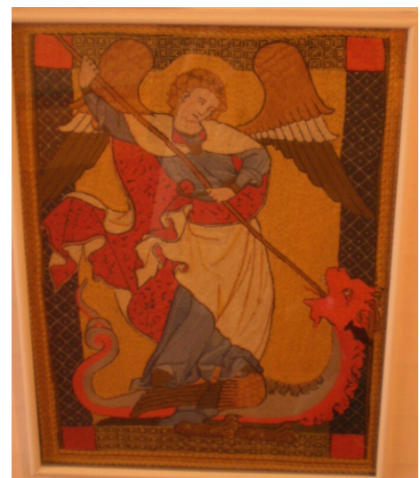
Saint Michel Terrassant le dragon