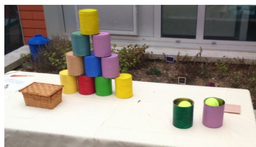
Jeu « le chamboule tout »