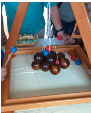
Jeu « le suspens »