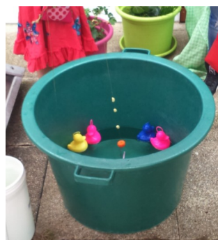
Pêche aux canards