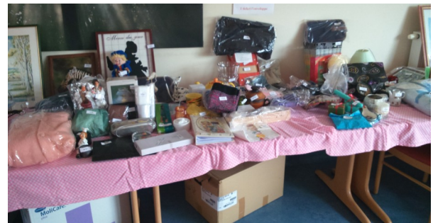
Cadeaux à gagner