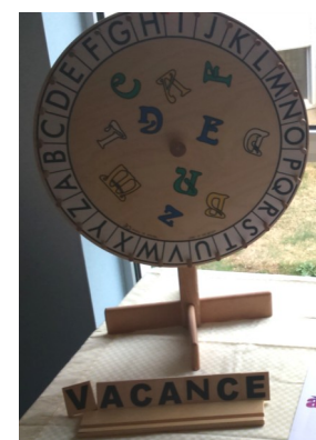
Jeu « lettre à Yanis »