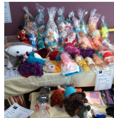
Stand de l'atelier tricot