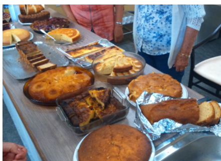
Stand de gâteaux