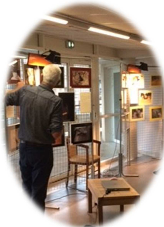
Exposition photos (février)