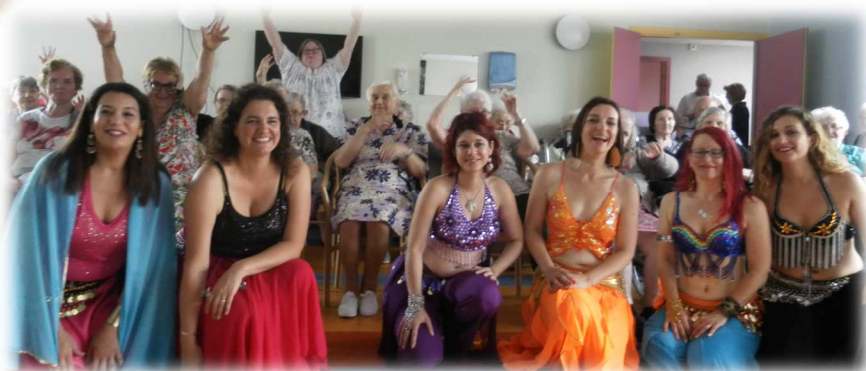
Danseuses Baladi sur le site des Primevères (juin)

Vous pouvez dès à présent nous faire part de vos suggestions ou remarques en adressant vos messages au service qualité de l'hôpital de Crépy-en-Valois c.guthbrod@ch-crepyenvalois.fr