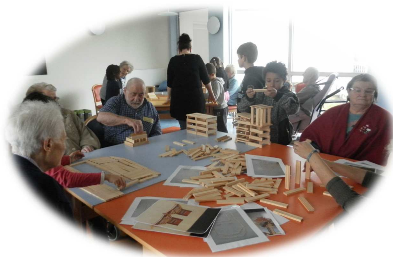
Rencontre intergénération avec le musée de l'archerie site Primevères (mars)