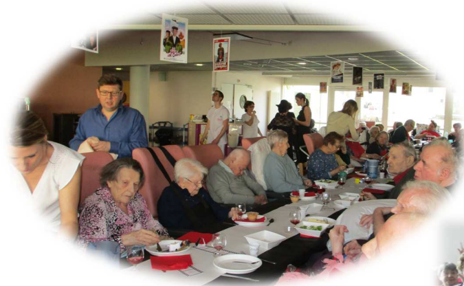
Repas sur le thème « cinéma » en USLD (mars)