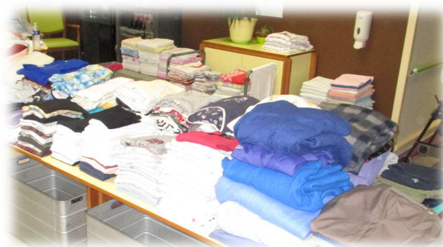
Présentation du linge « égaré » aux familles sur le site E.M. de La Hante (janvier)